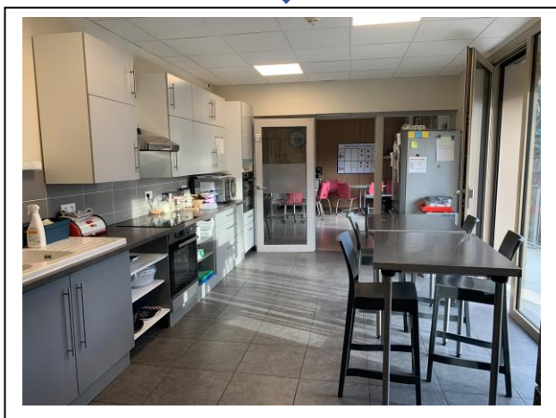
↓ Cuisine des Gantiers 1