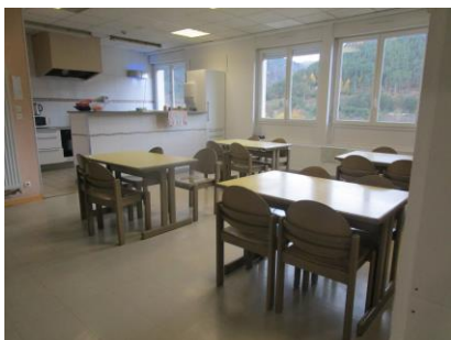
Salle à manger collective du 2 ème étage