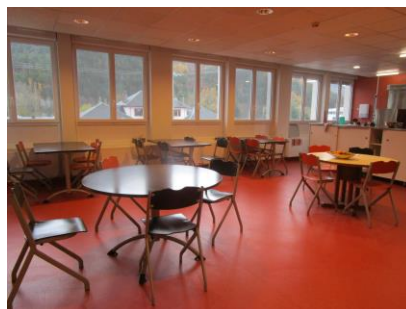
Salle à manger collective du Rez-de-chaussée